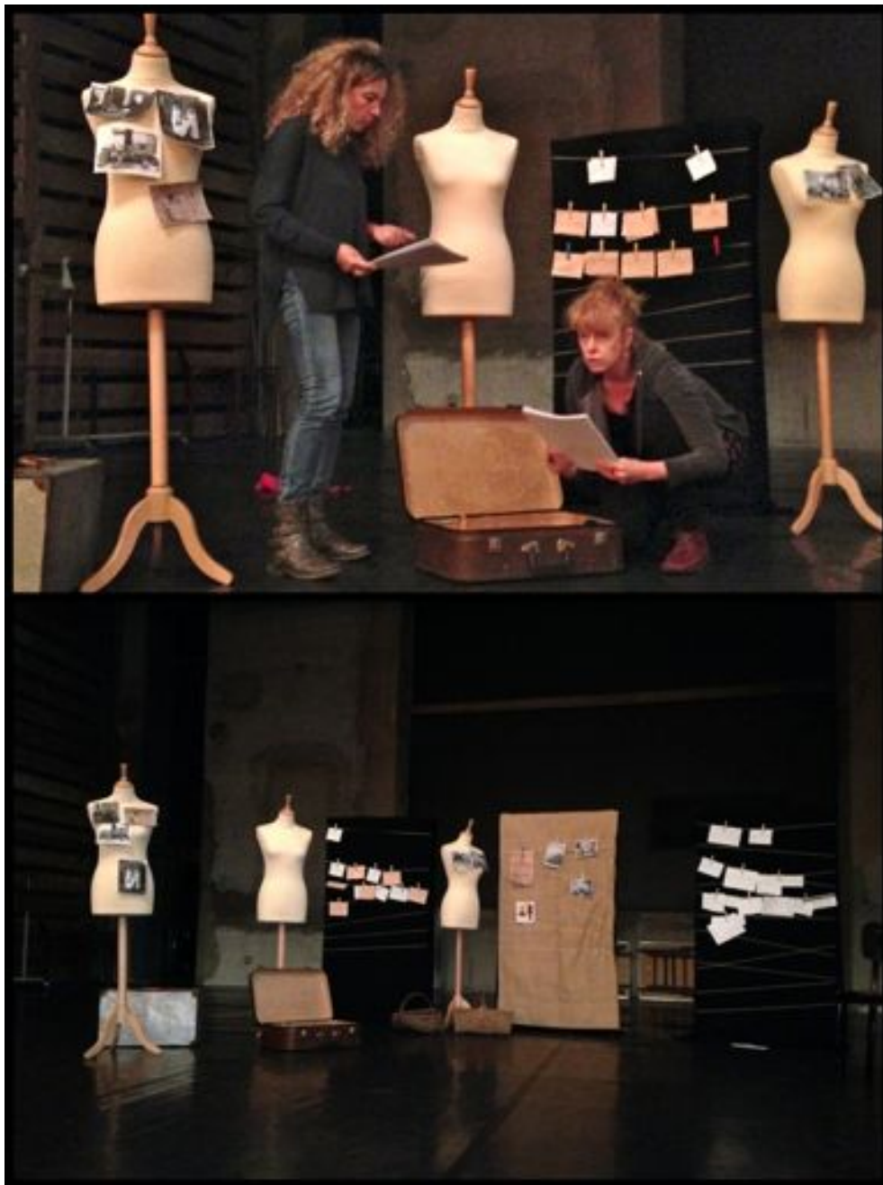
Répétition Théâtre Antoine Riboud - Evian

Médiathèque ou autre lieu non équipé : fournir 2 ou 4 projecteurs